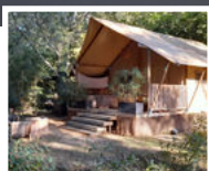
LODGES & CABANES