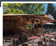
RESTAURANT & BAR